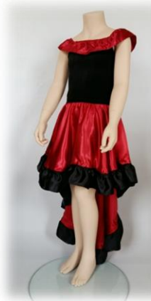
04-013-3 5.990.- forint