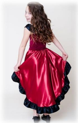
04-011-3 5.990.- forint

3-mas méret 128-134 (7-8 éveseknek): Felsőrész szélessége körben 54-62cm, hossza 26cm, váll szélessége körben 66cm, váll fodor 7cm, szoknya hossza elől 26cm, hátul 65cm, szoknya fodor 8cm