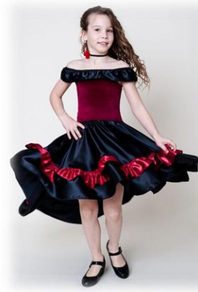
04-014-3 5.990.- forint