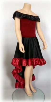
04-012-3 5.990.- forint